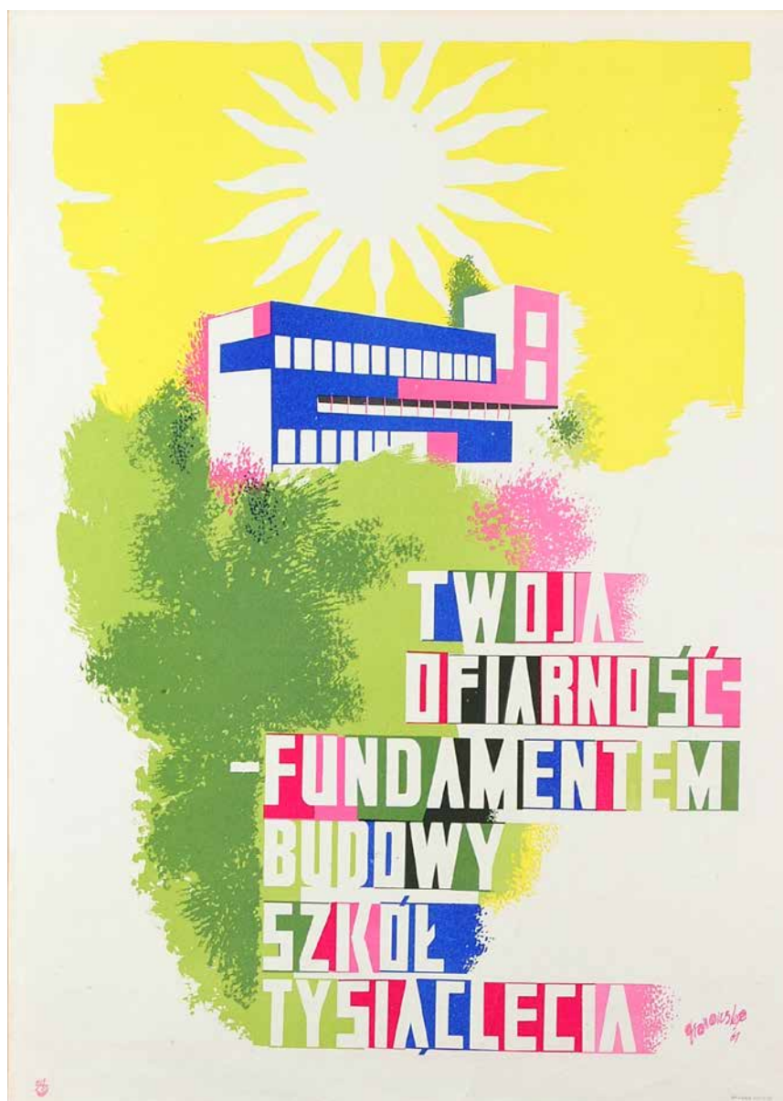
Szkoła-pomnik Tysiąclecia Państwa Polskiego Program „tysiąc szkół na tysiąclecie Państwa Polskiego” Polska, 1959-65 plakat autorstwa Tadeusza Gronowskiego, kolekcja Muzeum Plakatu MNW

W XX wieku pojawiła się idea upamiętniania ważnych wydarzeń i postaci historycznych za pomocą przedsięwzięć społecznie użytecznych: fundowania stypendiów czy wznoszenia budynków użyteczności publicznej. W latach 1959-1964 na terenie całej Polski realizowano projekt budowy 1000 szkół-pomników na Tysiąclecie Państwa Polskiego. Typowe modernistyczne budynki szkolne na trwałe wpisały się w krajobraz polskich miast, miasteczek i wsi.