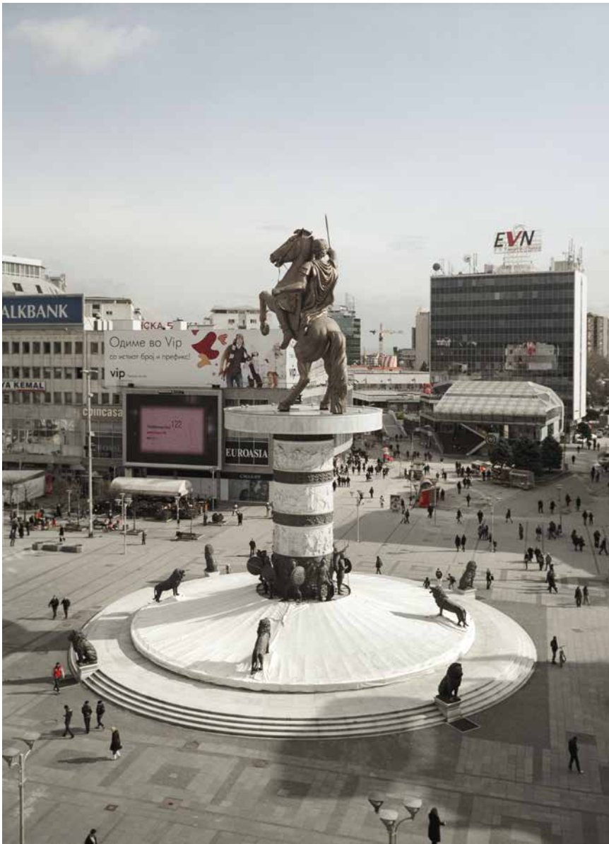
Pomnik Wojownika na koniu (Aleksander Macedoński), Skopje, Macedonia, 2011 z serii Alexander, 2013

Decyzja o wzniesieniu pomnika Aleksandra Macedońskiego na Placu Macedonii w Skopje zapadła w 2006 roku w ramach promowanego przez konserwatywną partię VMRO-DPMNE kształtowania zbiorowej tożsamości Macedończyków w oparciu o tradycję antyczną. Zgodnie z tą bardziej fantazmatyczną niż opartą na przesłankach historycznych ideą ruszył program przebudowy stolicy zatytułowany „Skopje 2014”. Ze względu na konflikt z Grecją, która upominała się o prawo do używania nazwy Macedonia jako jednej ze swoich prowincji oraz do powoływania się na symboliczną spuściznę po Aleksandrze Macedońskim, pomnik ze Skopje oficjalnie nosi nazwę Wojownik na koniu . Monument autorstwa Walentyny Stewanowskiej odsłonięto 8 września 2011 roku, w dwudziestą rocznicę ogłoszenia przez Macedonię niepodległości. Ekspresję pomnika-fontanny uzupełnia gra kolorowych świateł i oprawa muzyczna. Dziś, gdy władza w Macedonii przeszła w ręce partii liberalnych, rozważa się usunięcie monumentu, który od początku budził kontrowersje nie tylko natury politycznej, lecz także estetycznej.